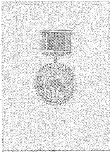
Зображення 1 Почесної відзнаки «За спасіння життя» (аверс)